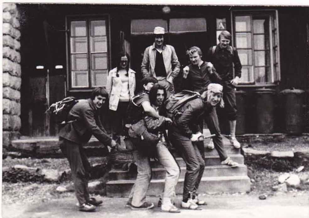
Na koštěti by to bylo lepší než pššky