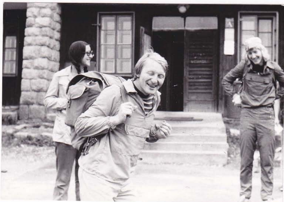
Před kurzovní chatou